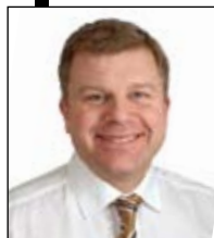
Key Account Manager